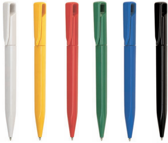
BI GI RO VE BL NE SERIE 330 CC

Made of the finest quality ABS, non-toxic, without lead, cadmium and any other heavy metals, in compliance with the strict European regulations on material safety. Top international quality writing thanks to X20 refills and Dokumental inks: the very best available on the market!