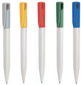
GR GI RO VE BL SERIE 330 BC