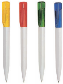
GI RO VE BL SERIE 330 BT