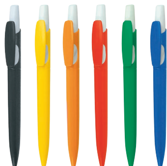
NE GI AR RO VE BL SERIE 220 CB